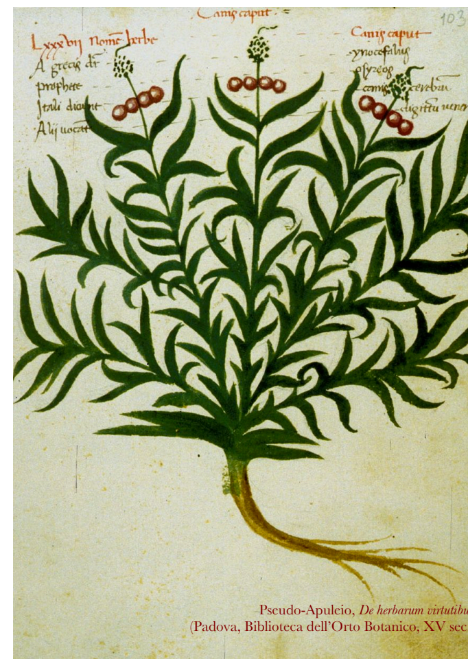
—Pseudo-Apuleio, De herbarum virtutibus (Padova, Biblioteca dell'Orto Botanico, XV sec.)