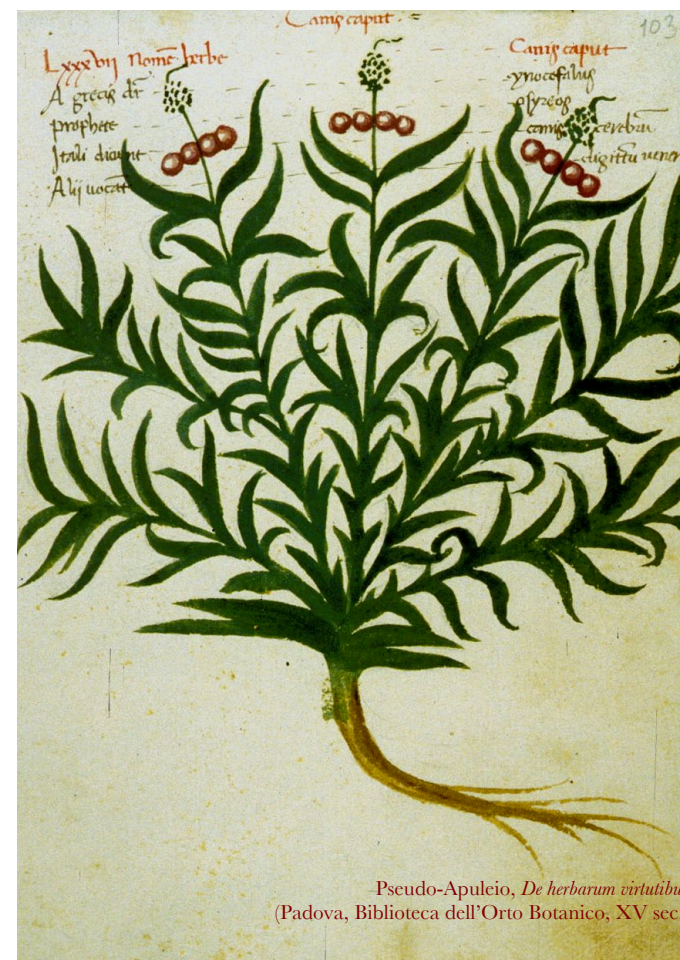
—Pseudo-Apuleio, De herbarum virtutibus (Padova, Biblioteca dell'Orto Botanico, XV sec.)